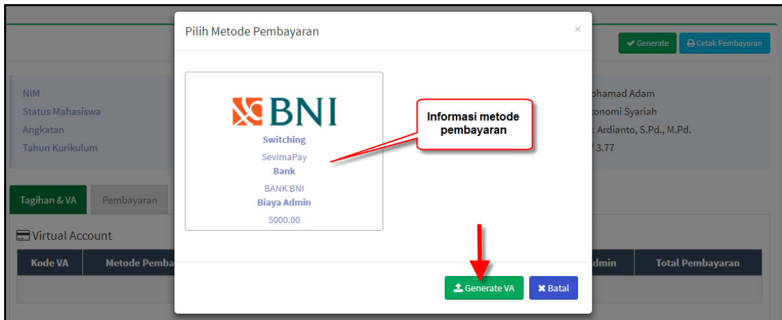
Gambar 2-2 Halaman Proses Generate VA Tagihan Kuliah